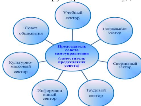
Структура Совета студентов

Каждый сектор Совета студентов ставит перед собой конкретные цели и задачи и отвечает за определенное направление деятельности: